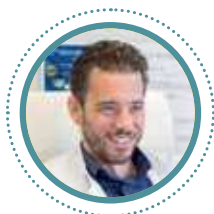
Από τον Dr. Χρήστο Μεγαπάνο Πλαστικό χειρουργό www.drmepapanos.gr

!! Συχνά, βλέπουμε την επιδερμίδα μας να θαμπώνει και να ξηραίνεται αυτήν την εποχή. Για όλα, όμως, υπάρχουν οι κατάλληλες λύσεις.