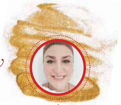
Από τη Μαργαρίτα Φραγκουλίδου Makeup artist

Ρεβεγιόν, πάρτι με φίλους και οικογένεια, και το μόνο βέβαιο είναι ότι θέλουμε να εντυπωσιάσουμε με τις εμφανίσεις μας.